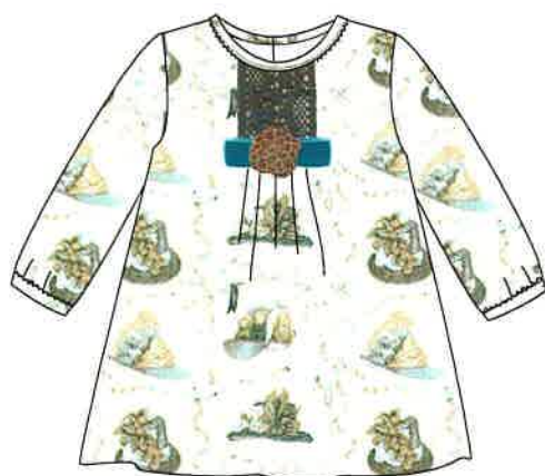
3 - azul