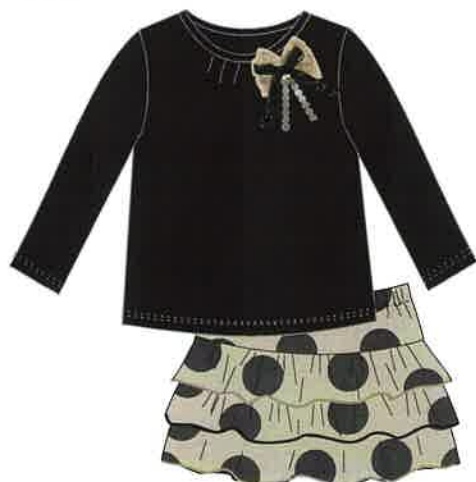
10 - negro