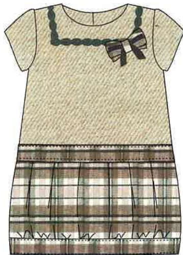
2 - beig