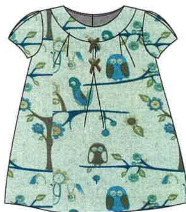
8 - azul

DENOMINACIÓN VESTIDO COMPOSICIÓN LANOSO 50% LANA 50% POLIESTER TALLAS 3M 6M 9M 12M 18M 24M 3A 4A 5A 6A