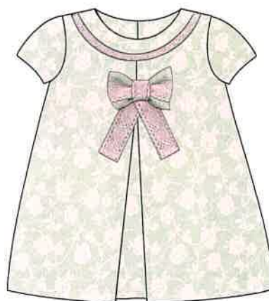
4 - rosa

DENOMINACIÓN VESTIDO COMPOSICIÓN VELVETÓN 89% POLIÉSTER 9% POLIAMIDA 2% ELASTANO TALLAS 3M 6M 9M 12M 18M 24M 3A 4A 5A 6A