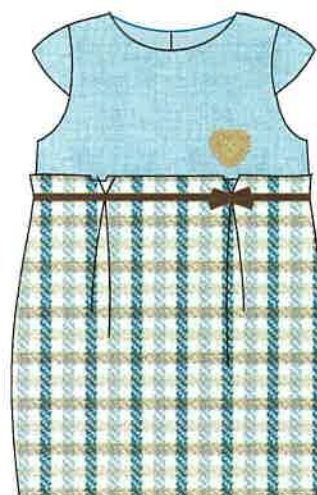
8 - azul

DENOMINACIÓN VESTIDO COMPOSICIÓN LANOSO 50% POLIÉSTER 25% LANA 25% ACRÍLICO TALLAS 3A 4A 5A 6A 8A 10A 12A