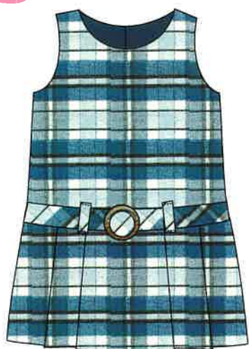
8 - azul