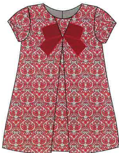
7 - rojo