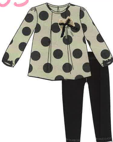
10 - negro