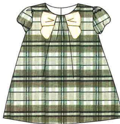
11 - marron

DENOMINACIÓN VESTIDO COMPOSICIÓN LANOSO 50% ALGODÓN 50% POLIÉSTER TALLAS 3M 6M 9M 12M 18M 24M 3A 4A 5A 6A