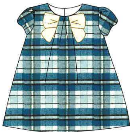
8 - azul