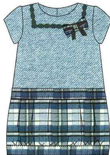
8 - azul

DENOMINACIÓN VESTIDO COMPOSICIÓN LANOSO 50% ALGODÓN 50% POLIÉSTER TALLAS 3A 4A 5A 6A 8A 10A 12A