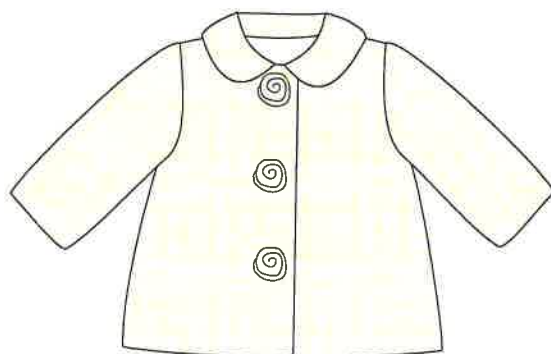
2 - beig