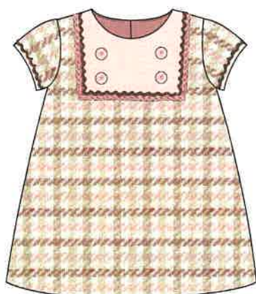
4 - rosa