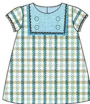
8 - azul

DENOMINACIÓN VESTIDO COMPOSICIÓN LANOSO 50% POLIÉSTER 25% LANA 25% ACRÍLICO TALLAS 3M 6M 9M 12M 18M 24M 3A 4A 5A 6A