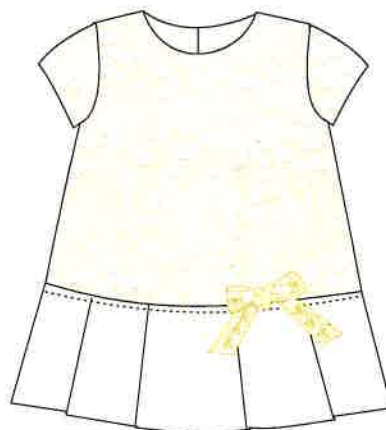
2 - beig

DENOMINACIÓN VESTIDO COMPOSICIÓN JAQUARD 100% POLIÉSTER TALLAS 3M 6M 9M 12M 18M 24M 3A 4A 5A 6A