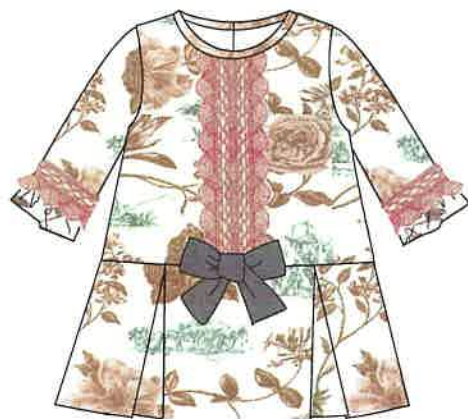
4 - rosa