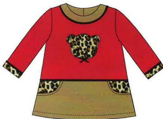
7 - rojo

DENOMINACIÓN VESTIDO COMPOSICIÓN PUNTO ROMA 70% POLIÉSTER 25% VISCOSA 5% ELASTANO TALLAS 3M 6M 9M 12M 18M 24M 3A 4A 5A 6A