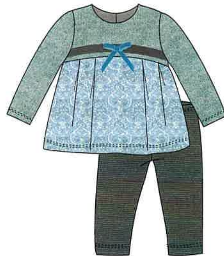
8 - azul