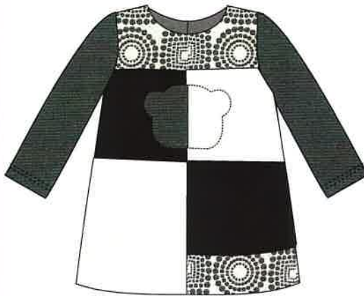
2 - beig