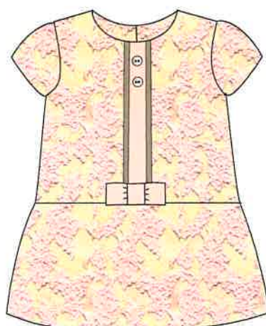
4 - rosa

DENOMINACIÓN VESTIDO COMPOSICIÓN TELA JAQUARD 75% ALGODÓN 23% POLIESTER 2% ELASTANO TALLAS 3M 6M 9M 12M 18M 24M 3A 4A 5A 6A