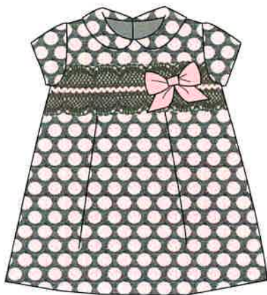
4 - rosa