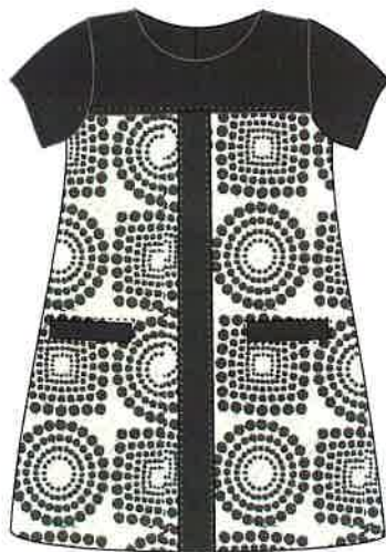
2 - beig