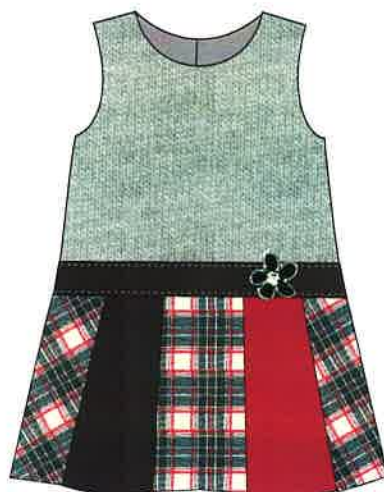
9 - gris

DENOMINACIÓN PICHY COMPOSICIÓN PUNTO TRICOT 100% ACRILICO TALLAS 3A 4A 5A 6A 8A 10A 12A