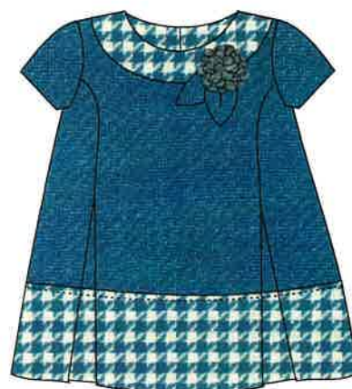
8 - azul

DENOMINACIÓN VESTIDO COMPOSICIÓN LANOSO 65% POLIÉSTER 35% LANA TALLAS 3M 6M 9M 12M 18M 24M 3A 4A 5A 6A