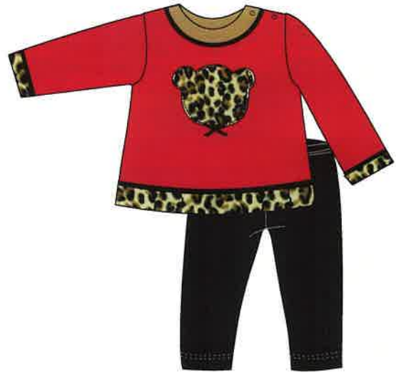
7 - rojo