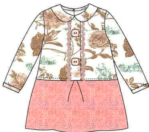
4 - rosa