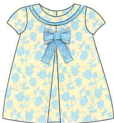
3 - celeste