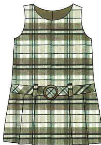
11 - marrón