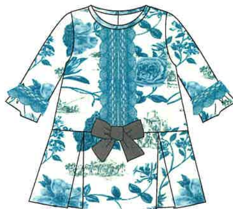
8 - azul

DENOMINACIÓN VESTIDO COMPOSICIÓN VIELLA 65% POLIÉSTER 35% ALGODÓN TALLAS 3M 6M 9M 12M 18M 24M 3A 4A 5A 6A