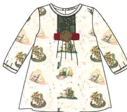
4 - rosa

DENOMINACIÓN VESTIDO COMPOSICIÓN VIELLA 65% POLIÉSTER 35% ALGODÓN TALLAS 3M 6M 9M 12M 18M 24M 3A 4A 5A 6A