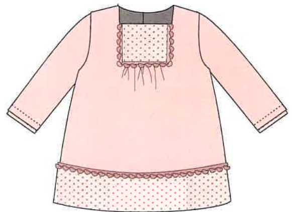
4 - rosa

DENOMINACIÓN VESTIDO COMPOSICIÓN PUNTO ROMA 70% POLIÉSTER 25% VISCOSA 5% ELASTANO TALLAS 3M 6M 9M 12M 18M 24M 3A 4A 5A 6A