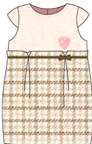
4 - rosa