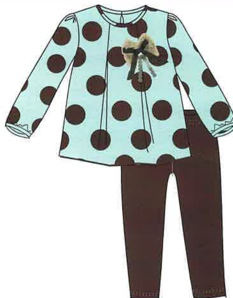
11 - marrón