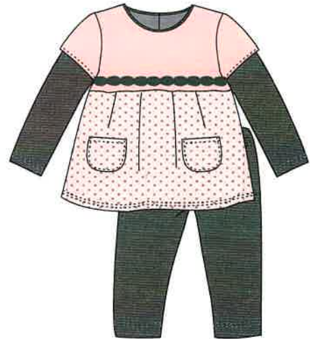
4 - rosa

DENOMINACIÓN CONJUNTO COMPOSICIÓN SUETER PUNTO ROMA 70% POLIÉSTER 25% VISCOSA 5% ELASTANO LEGGINS PUNTO ROMA 80% POLIÉSTER 15% RAYÓN 5% ELASTANO TALLAS 3M 6M 9M 12M 18M 24M 3A 4A 5A 6A