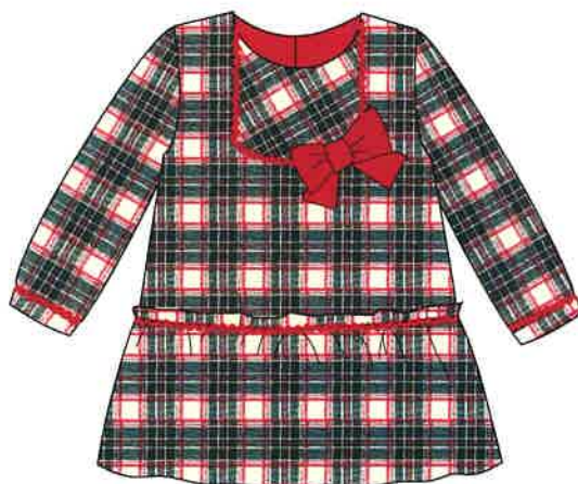
7 - rojo

DENOMINACIÓN VESTIDO COMPOSICIÓN VIELLA 50% ALGODÓN 50% POLIÉSTER TALLAS 3M 6M 9M 12M 18M 24M 3A 4A 5A 6A