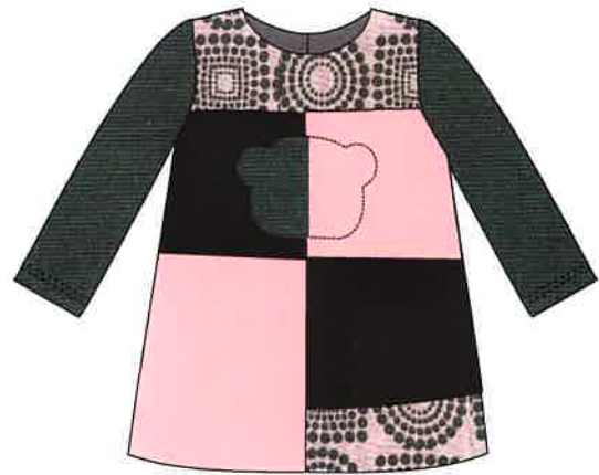
4 - rosa

DENOMINACIÓN VESTIDO COMPOSICIÓN PUNTO ROMA 80% POLIÉSTER 15% RAYÓN 5% ELASTANO TALLAS 3M 6M 9M 12M 18M 24M 3A 4A 5A 6A