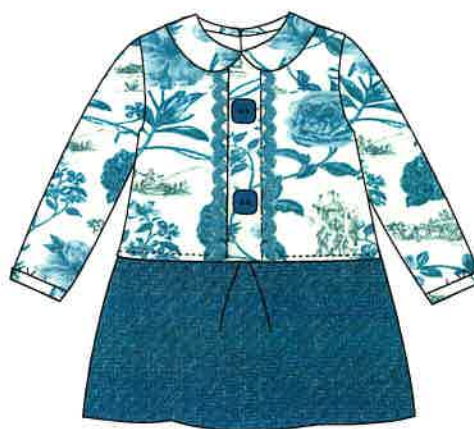
8 - azul

DENOMINACIÓN VESTIDO COMPOSICIÓN VIELLA 65% POLIÉSTER 35% ALGODÓN TALLAS 3M 6M 9M 12M 18M 24M 3A 4A 5A 6A