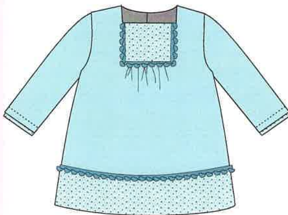
3 - azul