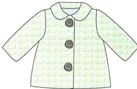
9 - gris

DENOMINACIÓN CHAQUETÓN COMPOSICIÓN PELO 100% POLIÉSTER TALLAS 3M 6M 9M 12M 18M 24M 3A 4A 5A 6A