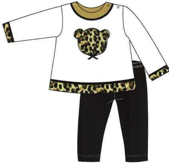
2 - beig