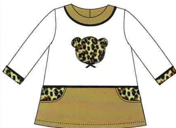
2 - beig