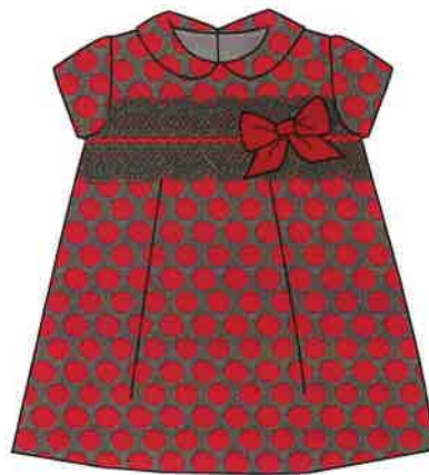
7 - rojo

DENOMINACIÓN VESTIDO COMPOSICIÓN TELA JAQUARD 47% ACRÍLICO 42% POLIÉSTER 11% ALGODÓN TALLAS 3M 6M 9M 12M 18M 24M 3A 4A 5A 6A