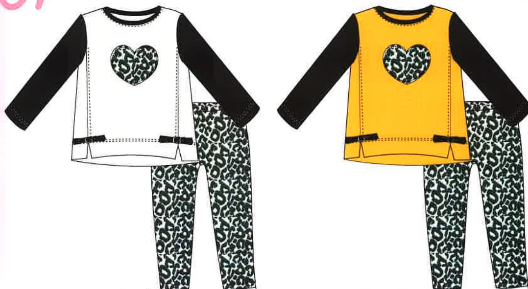
2 - beig