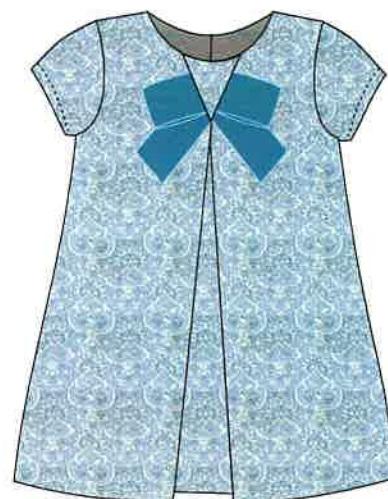
8 - azul

DENOMINACIÓN VESTIDO COMPOSICIÓN PUNTO ROMA 70% POLIÉSTER 25% VISCOSA 5% ELASTANO TALLAS 3A 4A 5A 6A 8A 10A 12A