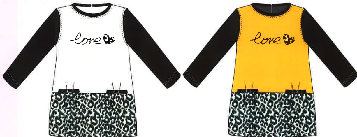
2 - beig