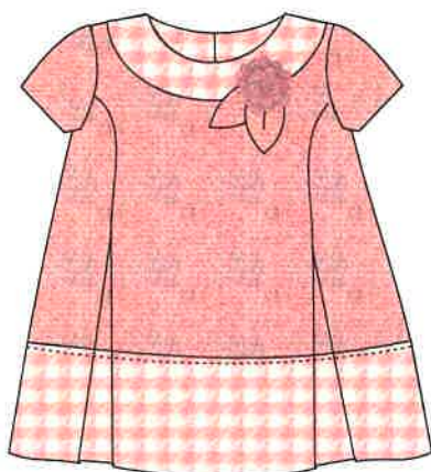
4 - rosa