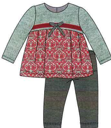
7 - rojo