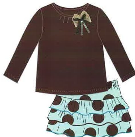
11 - marrón