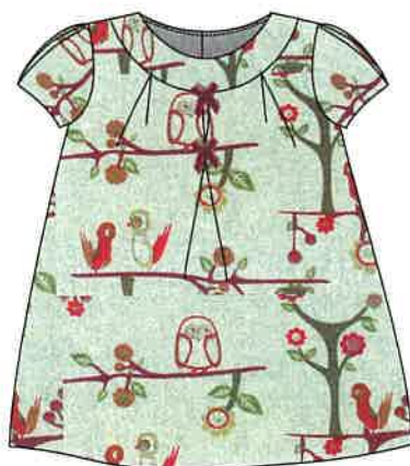
7 - rojo