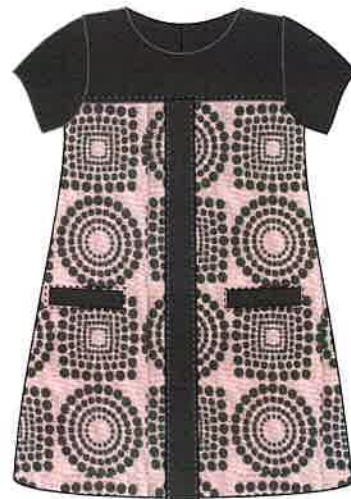
4 - rosa

DENOMINACIÓN VESTIDO COMPOSICIÓN PUNTO ROMA 80% POLIÉSTER 15% RAYÓN 5% ELASTANO TALLAS 3A 4A 5A 6A 8A 10A 12A