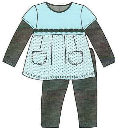
3 - azul