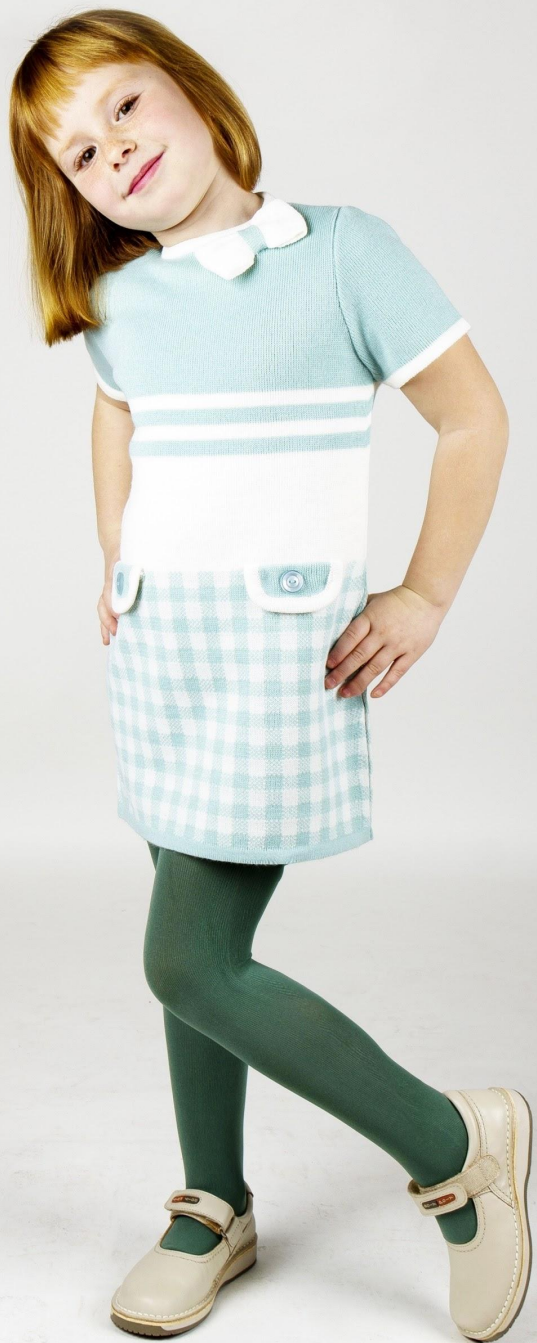
REF: 18.411. VESTIDO CUADROS CON TAPETAS BOLSILLO Y LAZADA CUELLO